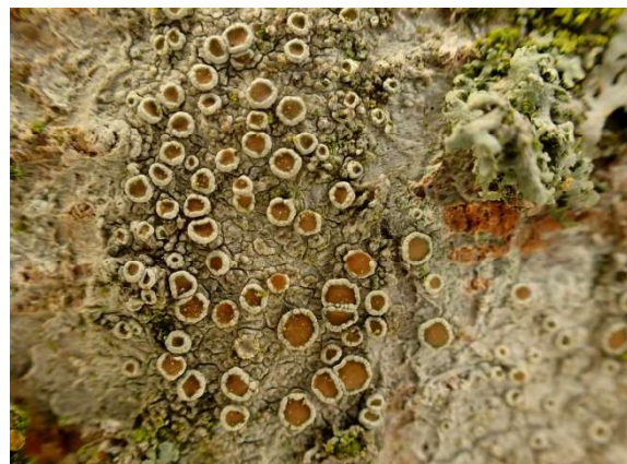
Witte schotelkorst Lecanora chlorotera

Wanneer er geen rijp op de apotheciën aanwezig is dan heb je te maken met de andere soort die veel op jonge boompjes voorkomt, de Witte schotelkorst Lecanora chlorotera . Een onderscheid dat lastig lijkt maar wanneer je beide soorten een paar maal gezien hebt tijdens een excursie en de verschillen uitgelegd hebt gekregen is het eigenlijk heel eenvoudig!