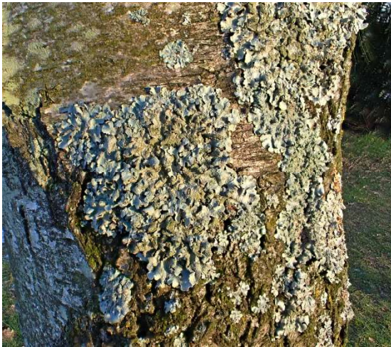
Gewoon schildmos Parmelia sulcata

Korstmossen zijn geen mossen maar zijn een bijzondere groep organismen die de symbiose zijn van een schimmelsoort met één of meer algen of bacteriën. De wetenschappelijke benaming voor deze groep is lichenen.