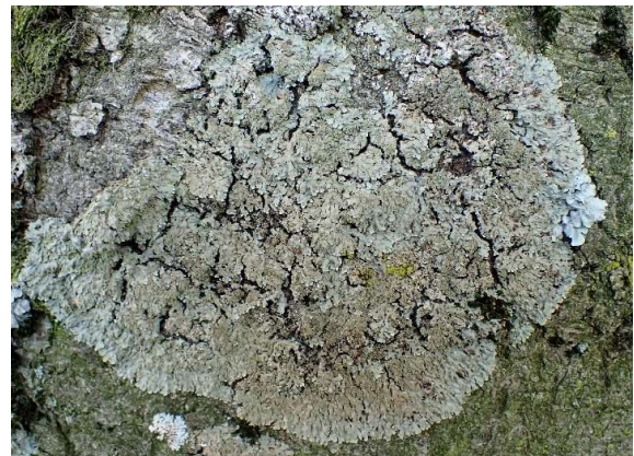
Grauw rijpmos Physconia grisea

Een andere algemeen voorkomende soort is het Witstippelschildmos Punctelia borreri . De lobben van het thallus zijn heldergrijs, onberijpt en tot aan de uiterste rand bezet met witte meest ovale pseudocyphellen. De soralen zijn wittig-groenig en beginnen vanuit het centrum en vaak is deze soort in opvallend grote onregelmatig gevormde plakken aanwezig op de boom.