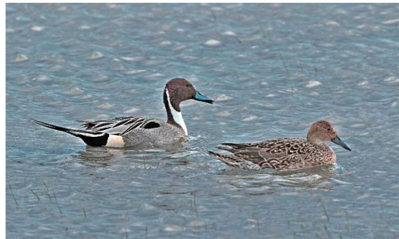
Pijlstaart, man en vrouw

Op zoek naar weer open water rijden we door naar de Rammegors op St. Philipsland. Daar is een inlaat gemaakt waardoor er continue water in en uit het gebied kan stromen. Bij die inlaat is een muur waarachter je iets beschut staat tegen de kou. Geïnspireerd door het weer zagen we daar de mini-pinguïn, een vogel die je in Nederland alleen in de ijstijd tegenkomt. Eerlijk gezegd lijkt het echt een pinguïn als je ver weg, op de grens van het bereik van de kijker alleen de witte borsten van een heleboel kleumende Pijlstaarten naast elkaar ziet staan.