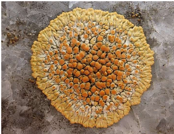
Sinaasappelkorst Calogaya pusilla

Tot slot nog een tweetal soorten die je vaak tegenkomt op lage bakstenen tuinmuurtjes en de bakstenen muren rondom kerkhoven. De eerste is een heel opvallende soort die eenvoudig herkenbaar is met de welluidende naam Sinaasappelkorst Calogaya pusilla . De oranje met gele plakkaatjes springen echt in het oog. Over het algemeen zijn ze rond en niet al te groot, vaak met een doorsnede van 1-6 cm. Met het blote oog, maar zeker met een loepje, is goed te zien dat in het midden vele helder oranje apotheciën met een dun licht randje aanwezig zijn. Naar de buitenzijde uitstralend heeft dit lichen smalle, berijpte lobben met een heldergele kleur. Tussen de apotheciën en in de overgangszone van apotheciën naar lobjes is het lichtgele tot oranje gele thallus goed zichtbaar. Vaak is deze soort massaal aanwezig. Het zijn dan net kleine zonnetjes die je vanaf de steen je tegemoet stralen!