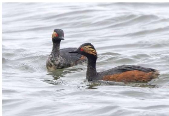
Geoorde Fuut - Podiceps nigricollis

Informatie over de vogelstand in Nederland is te vinden bij SOVON. Daar vind je bijv. dat de Kuifleeuwerik al sinds vijf jaar is uitgestorven maar dat broedende Scholeksters steeds meer op daken te vinden