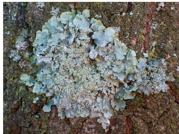
Witstippelschildmos Punctelia borreri

Een andere algemeen voorkomende soort is het Witstippelschildmos Punctelia borreri . De lobben van het thallus zijn heldergrijs, onberijpt en tot aan de uiterste rand bezet met witte meest ovale pseudocyphellen. De soralen zijn wittig-groenig en beginnen vanuit het centrum en vaak is deze soort in opvallend grote onregelmatig gevormde plakken aanwezig op de boom.