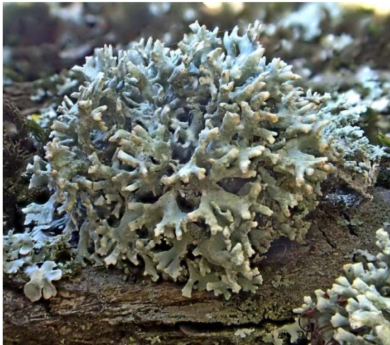
Eikenmos Evarnia prunastri

Veel struikvormige soorten korstmos zijn gevoelig voor de toegenomen stikstofbelasting. Een heel kenmerkende soort in dit verband is het Eikenmos Evarnia prunastri die enkele decennia geleden massaal en algemeen voorkwam maar tegenwoordig op steeds meer plaatsen sterk afneemt of zelfs al verdwenen is! De soort laat zich herkennen door het struikvormig voorkomen, onregelmatig en dicht vertakt. De takjes zijn plat met een groenig-grijze bovenzijde en een altijd witte onderzijde. De details zijn echt prachtig om door je loepje te bekijken! Vind je een gezonde populatie van deze soort met meerdere struikjes op een boom dan is dat een goede indicator voor een lage stikstofbelasting ter plaatse.