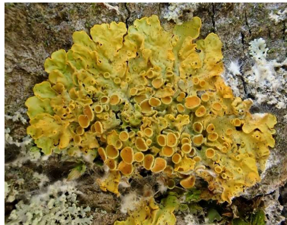
Groot dooiermos Xanthoria parietina

Twee gele soorten die je tegenwoordig overal in de bebouwde omgeving vindt zijn het alomtegenwoordige Groot dooiermos Xanthoria parietina en het veel kleinere Vals dooiermos Candelaria concolor .