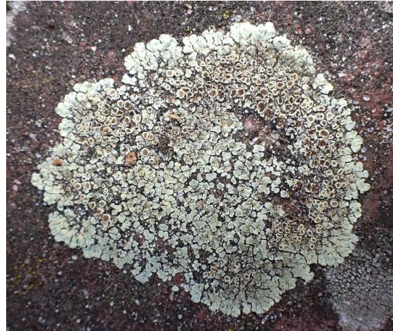
Muurschotelkorst Lecanora muralis

Het eerste licheen waar je letterlijk op trapt wanneer je de deur uit gaat is een heel algemeen voorkomende soort die iedereen onbewust al eens waargenomen heeft: Muurschotelkorst Lecanora muralis , of beter benoemd Protoparmeliopsis muralis , de naamgeving van lichenen is erg aan verandering onderhevig vanwege snel voortschrijdend wetenschappelijk inzicht in de taxonomie. Deze soort groeit op vrijwel ieder trottoir en wordt nogal eens uitgescholden voor ordinaris kauwgomplakkaat. Wanneer je echter op de knieën gaat en de groengrijze vlekken op het trottoir door je loepje bekijkt zie je al snel de intricate vormen van de lobjes, de prachtig groenig tot bruinig gekleurde apotheciën en de veelvormigheid die deze algemene soort vaak al op één vierkante meter laat zien! Deze soort is zo variabel van vorm dat het de meeste beginnend lichenologen heel wat hoofdbrekens kost voor ze hem goed hebben leren herkennen.