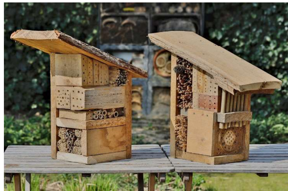
Bijenhôtels, voorbeeld - Foto: Annemiek van Dijk