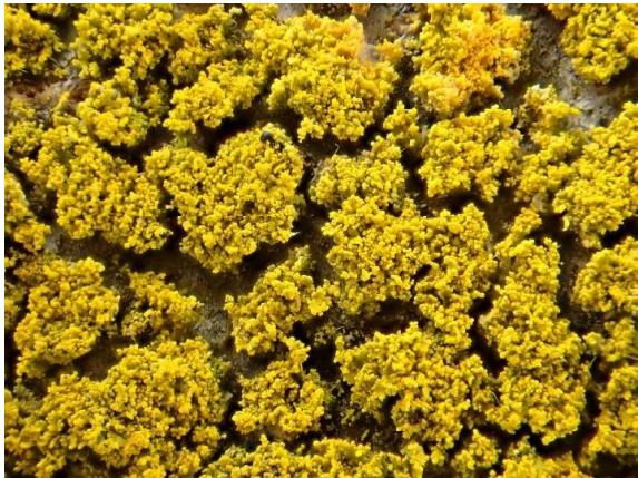
Vals dooiermos Candelaria concolor

Waar de “gele soorten” op bomen over het algemeen eenvoudig herkenbaar zijn ligt dat voor de “grijze en grijsgroene soorten” een stukje ingewikkelder. Doch door goed observeren en zorgvuldig de waargenomen kenmerken vergelijken met de informatie in de boeken is er ook prima uit te komen.