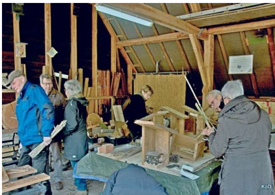
Bijenhôtels maken

Vóór vrijdag 1 maart 2024 via de website eindhoven.knnv.nl of per mail aan cursussen@eindhoven.knnv.nl onder vermelding van naam, adres, woonplaats, e-mailadres en telefoonnummer. Na uw aanmelding ontvangt u een bevestigingsmail met de betaalgegevens.