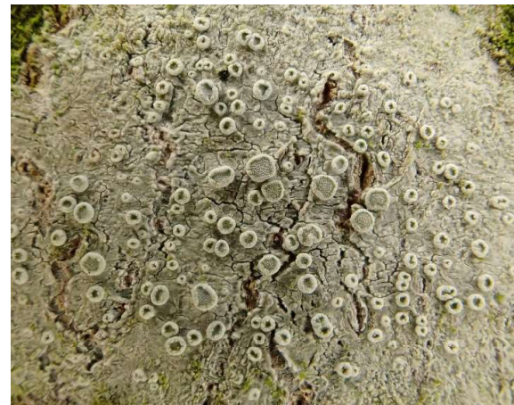
Melige schotelkorst Lecanora carpinea

Wanneer er geen rijp op de apotheciën aanwezig is dan heb je te maken met de andere soort die veel op jonge boompjes voorkomt, de Witte schotelkorst Lecanora chlorotera . Een onderscheid dat lastig lijkt maar wanneer je beide soorten een paar maal gezien hebt tijdens een excursie en de verschillen uitgelegd hebt gekregen is het eigenlijk heel eenvoudig!