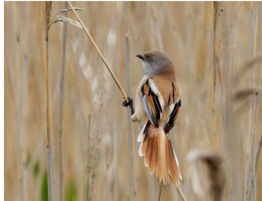
Baardmanneling, vrouw - Panurus biarmicus

Ook bijzondere waarnemingen worden met elkaar gedeeld, zoals de paring van 2 Slechtvalken op de kerktoeren in Geldrop, en 50 Kraanvogels over de Herbertusbossen en vele andere. Een paar mooie waarnemingen uit de Marker Wadden zijn als foto bijgevoegd.